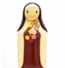
Imagem: Santa Teresinha do Menino Jesus.

Lema: “Na IM a vida está em primeiro lugar.”