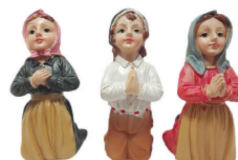
Imagem: Pastorinhos de Fátima.

Lema: “Sem crianças não há futuro. Sim à VIDA”, ou “Nós as crianças somos o futuro do mundo.”