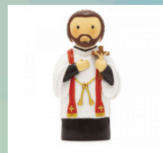
Imagem: São Francisco Xavier.

Lema: "Ajuda-nos a crescer com respeito e dignidade."